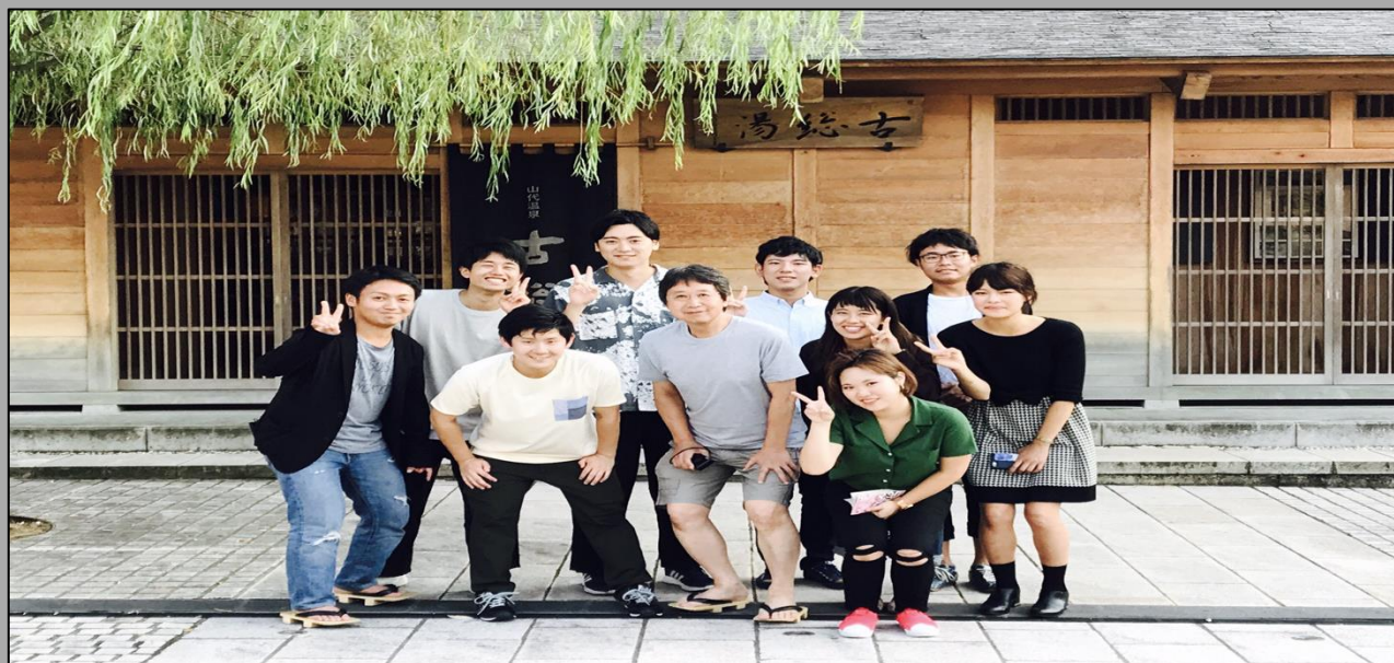
9月のゼミ旅行 to 金沢