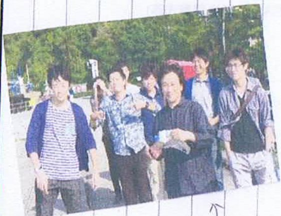
ゼミ生と観光を楽しむ 堂目先生☆