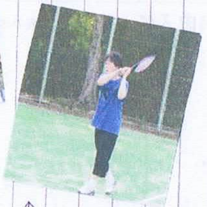
ゼミ生とテニスをやる 堂目先生の